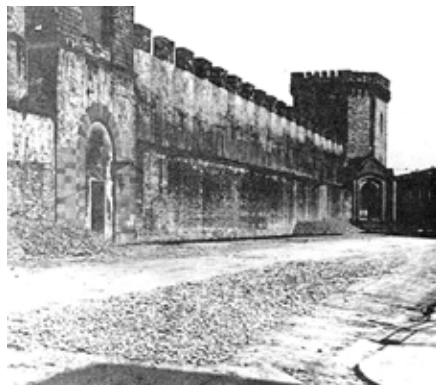
Le mura con il Torrino di Santa Rosa. Foto d'epoca

Il Torrino di Santa Rosa, era anticamente chiamata "della Guardia" perché guardava e difendeva la riva sinistra dell'Arno impedendo, con l'omonima pescaia, l'ingresso alle imbarcazioni nemiche che potevano risalire la corrente del fiume. Il toponimo del torrino deriva dall'oratorio della Compagnia di Santa Rosa annesso al soppresso monastero di Santa Maria in Verzaia, passato poi ai Guglielmiti di Sant'Antonio. L'oratorio fu posto in angolo alla cinta trecentesca delle mura, a ridosso del suddetto Torrino di Guardia (eretto nel 1324), perciò denominato anche del Cantone di Santa Rosa. Nel punto delle mura dove alla fine del Novecento è stato aperto un fornice, già nel 1856 era stato costruito, incastonato nel Torrino, un grande tabernacolo di forme neo-gotiche che tuttora si ammira. Nella sua nicchia a sesto acuto, è protetto un grande affresco dei primi del Cinquecento, dipinto da Domenico Ghirlandaio o, quantomeno, da Ridolfo del Ghirlandaio rappresentante la Pietà con la Madonna e i Santi Giovan-