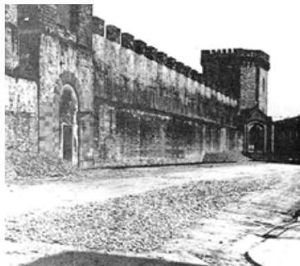
Le mura con il Torrino di Santa Rosa. Foto d'epoca

Il Torrino di Santa Rosa, era anticamente chiamata "della Guardia" perché guardava e difendeva la riva sinistra dell'Arno impedendo, con l'omonima pescaia, l'ingresso alle imbarcazioni nemiche che potevano risalire la corrente del fiume. Il toponimo del torrino deriva dall'oratorio della Compagnia di Santa Rosa annesso al soppresso monastero di Santa Maria in Verzaia, passato poi ai Guglielmiti di Sant'Antonio. L'oratorio fu posto in angolo alla cinta trecentesca delle mura, a ridosso del suddetto Torrino di Guardia (eretto nel 1324), perciò denominato anche del Cantone di Santa Rosa. Nel punto delle mura dove alla fine del Novecento è stato aperto un fornice, già nel 1856 era stato costruito, incastonato nel Torrino, un grande tabernacolo di forme neo-gotiche che tuttora si ammira. Nella sua nicchia a sesto acuto, è protetto un grande affresco dei primi del Cinquecento, dipinto da Domenico Ghirlandaio o, quantomeno, da Ridolfo del Ghirlandaio rappresentante la Pietà con la Madonna e i Santi Giovan-